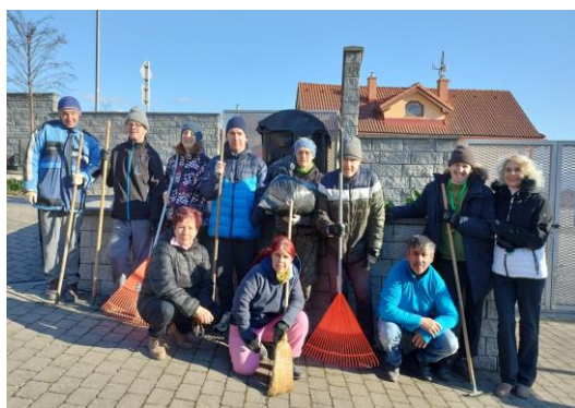
Foto: Upratovanie verejných priestorov cintorína