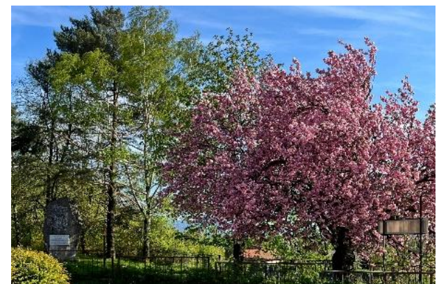
Foto: Jarná pýcha nášho parku