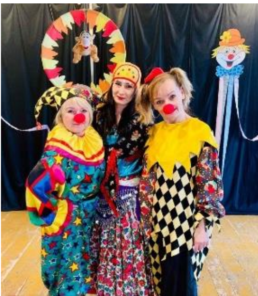
Foto: Detský karneval s témou cirkus