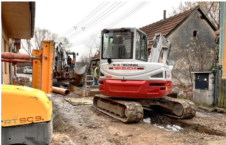
Foto: Proces výstavby kanalizácie

sme vo fáze intenzívnej výstavby kanalizácie v našej obci. Musíme znášať obmedzenia v doprave, prach, hluk a vibrácie z ťažkých strojov. Dovoľte mi poďakovať sa za Vašu trpezlivosť, súčinnosť a ústretové riešenia pri možnostiach pripájania Vašich nehnuteľností v tomto náročnom projekte. Domácnosti,