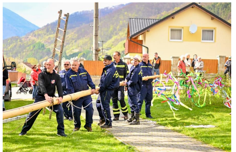
Foto: Minuloročné stavenie mája