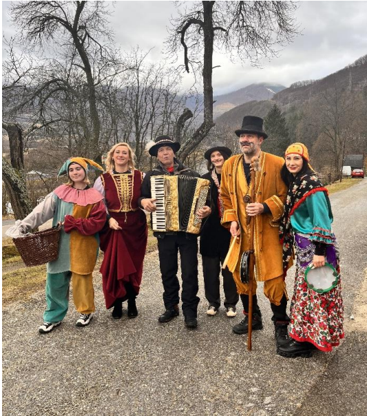
Foto: Fašiangový sprievod