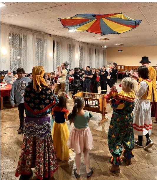
Foto: Netradičné uspávanie hudobných nástrojov na detskom karnevale