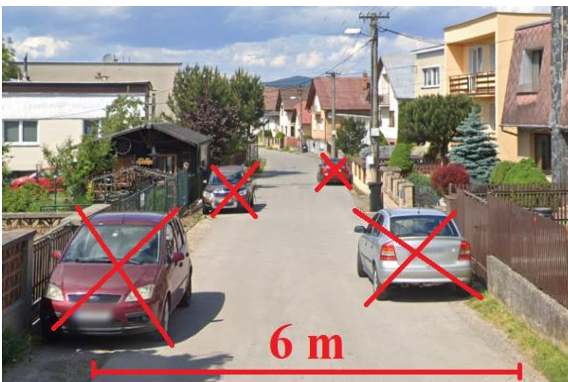
Foto: Ilustračný záber nesprávneho parkovania

Naše obecné zastupiteľstvo prerokovávalo problematiku parkovania zodpovedne. Na komisii aj na zasadnutí zastupiteľstva. Diskutovali hodiny, aby našli riešenie, ktoré by najmenej „bolelo“ tých, ktorí na ceste parkujú, no zároveň také, aby sme dostali autá z cesty preč. Uzniesli sa rozumne. Najskôr na potrebe informovať občanov upozornovaním a osvetou, ako aj prípravou podmienok a poskytnutím „preklenovacieho obdobia“ tak, aby každý mal čas na vyriešenie svojho parkovania. Do konca roka 2024. Áno, niektoré nehnuteľnosti (ale je ich naozaj málo) nemajú z komunikácie dost priestoru na parkovacie státa na svojom pozemku.