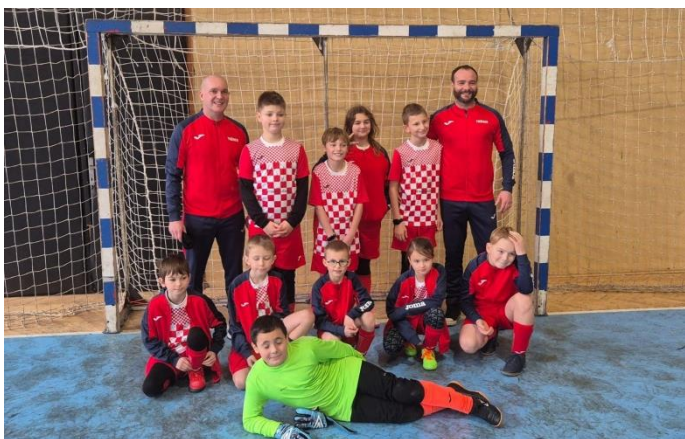
Foto: Spoločná foto po úspešnom turnaji