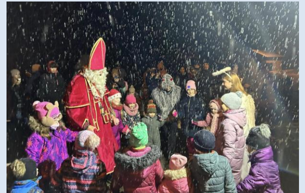
Foto: Zábava s Mikulášom