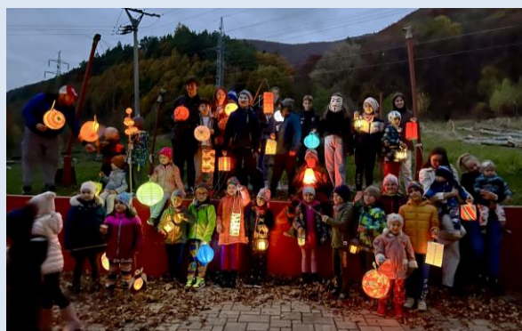
Foto: Lampiónový sprievod