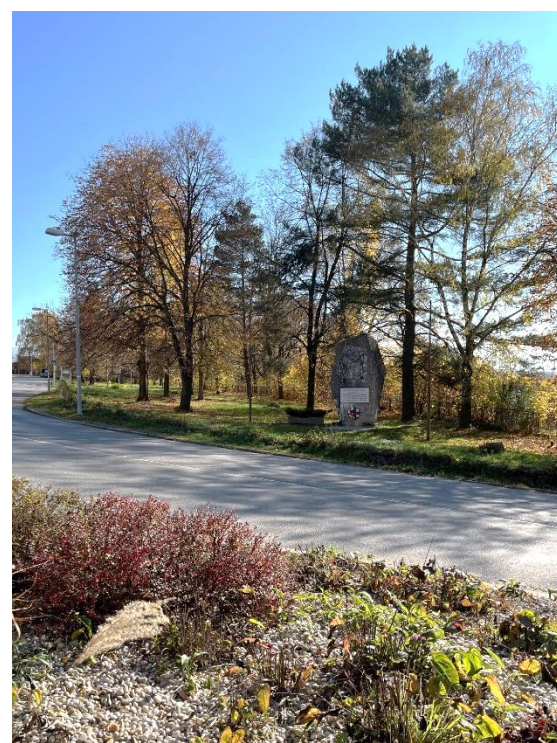
Foto: Odstránené zábradlie v parku

Okrem týchto veľkých a náročných projektov budeme pokračovať s revitalizáciou parku pri derivačnom kanáli. Nutne sme potrebovali vybudovať bezpečnejší prechod chodcov smerom od autobusovej zastávky k mostu a do časti Pod kanálom. Po odstránení zábradlia sa rozšíri chodník pre peších a smerom na Turčianske Kľačany od zastávky vznikne aj pár pozdĺžnych parkovacích miest, aby stojace autá neblokovali hlavnú cestu. Stredom parku osadíme niekoľko lavičiek a park budeme udržiavať ako zelenú oddychovú zónu pre návštevníkov. Parkovanie na cestách je u nás stále aktuálna téma. Dostali sme stavebné povolenie aj na parkovisko pri materskej škole, ktoré verím budeme môcť v roku 2025 vybudovať z vlastných zdrojov. V tomto roku vybudujeme z dotácií z Environmentálneho fondu aj prekryté stojiská na nádoby na odpad a zaobstaráme malý bager, aby sme boli schopní si drobné zemné práce robiť svojpomocne. Obec Lipovec sa zapojila na konci roka do ďalších eurofondových výziev, jednou z najdôležitejších je inkluzívne detské ihrisko pri materskej škole, do ktorého by malo mať prístup každé dieťa z obce. Držme si palce, aby sme boli pri prideľovaní dotácií aspoň tak úspešní, ako v roku 2024.