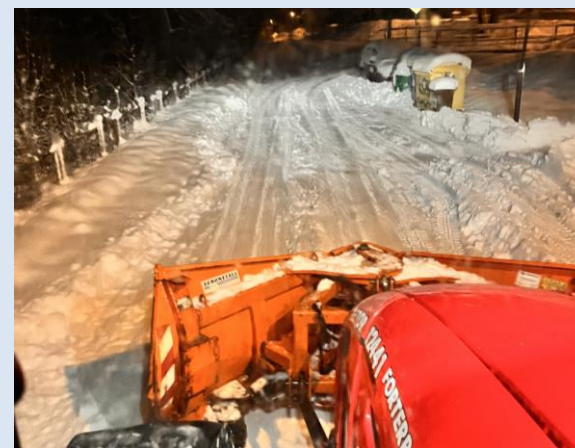
Foto: Zimná údržba v obci