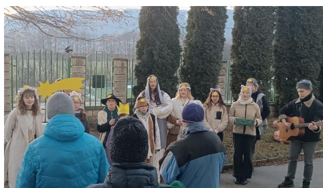
Foto: Koledníci v DSS Méta Lipovec