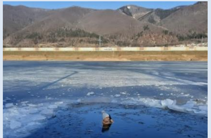
Foto: Otužovanie na Lipoveckých jazerách